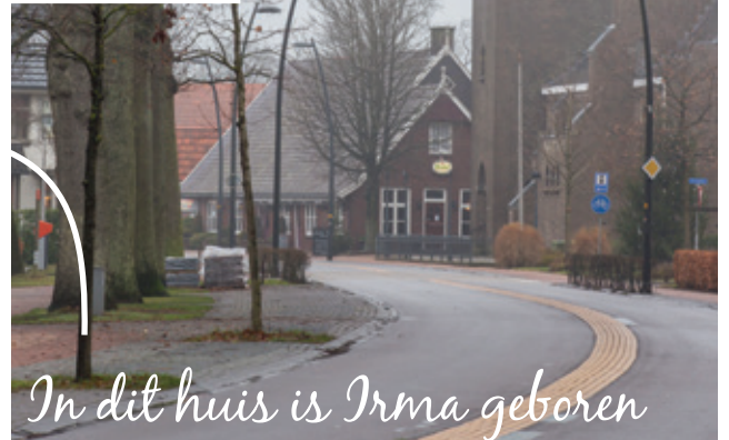
In dit huis is Irma geboren